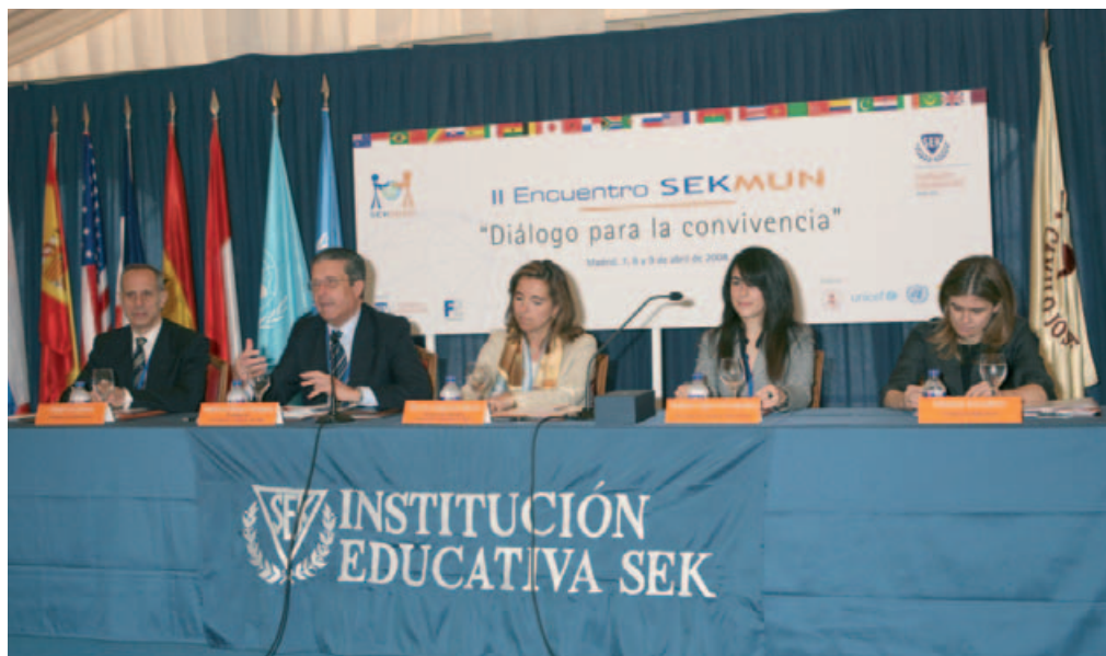
II Encuentro SEKMUN. Discurso de Inauguración a cargo de D. Federico Mayor Zaragoza.

alto nivel -incluidos 147 Jefes de Estado y de Gobierno-, establecieron objetivos medibles en todas las esferas de actividad de las Naciones Unidas. En septiembre de 2005, la comunidad internacional se reúne de nuevo en una segunda cumbre de alto nivel para garantizar que se cumplan esos objetivos. De nuevo, en septiembre de 2010, los líderes del mundo se volvieron a reunir en la sede de la ONU y fijaron acciones concretas para alcanzar los objetivos de desarrollo del Milenio para el 2015.